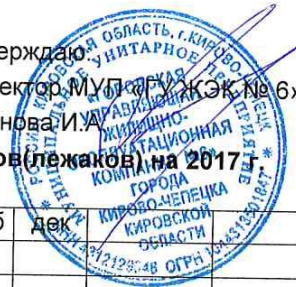
График профилактической чистки канализационных стояков (лежаков) на 2017г.