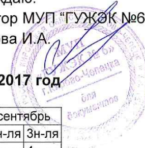
График подметания внутридворовых проездов подходов к подъездам и территорий без твердого покрытия на 2017 год