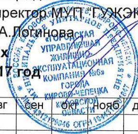
График профилактической чистки канализационных канализационных стояков (лежаков) и выпусков на 2017 год